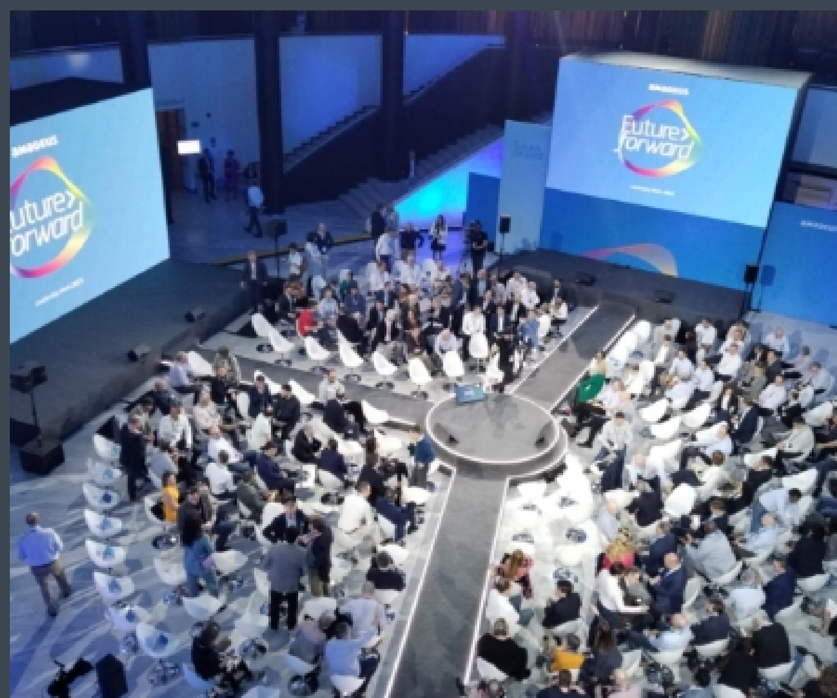
Amadeus Future Forward 2023