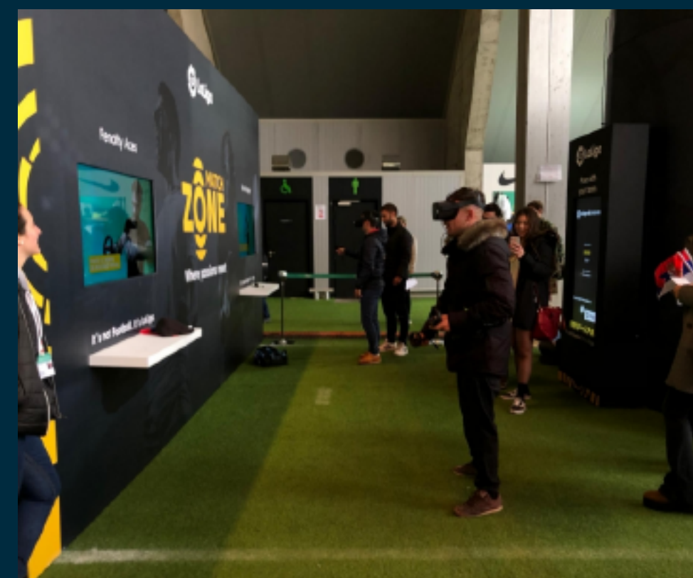
LaLiga Copa Davis Madrid