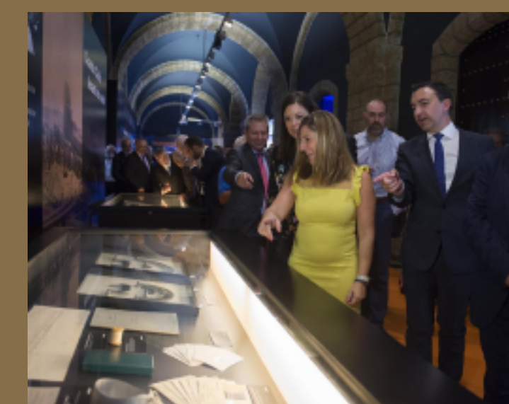
90 Aniversario Airbus Cádiz