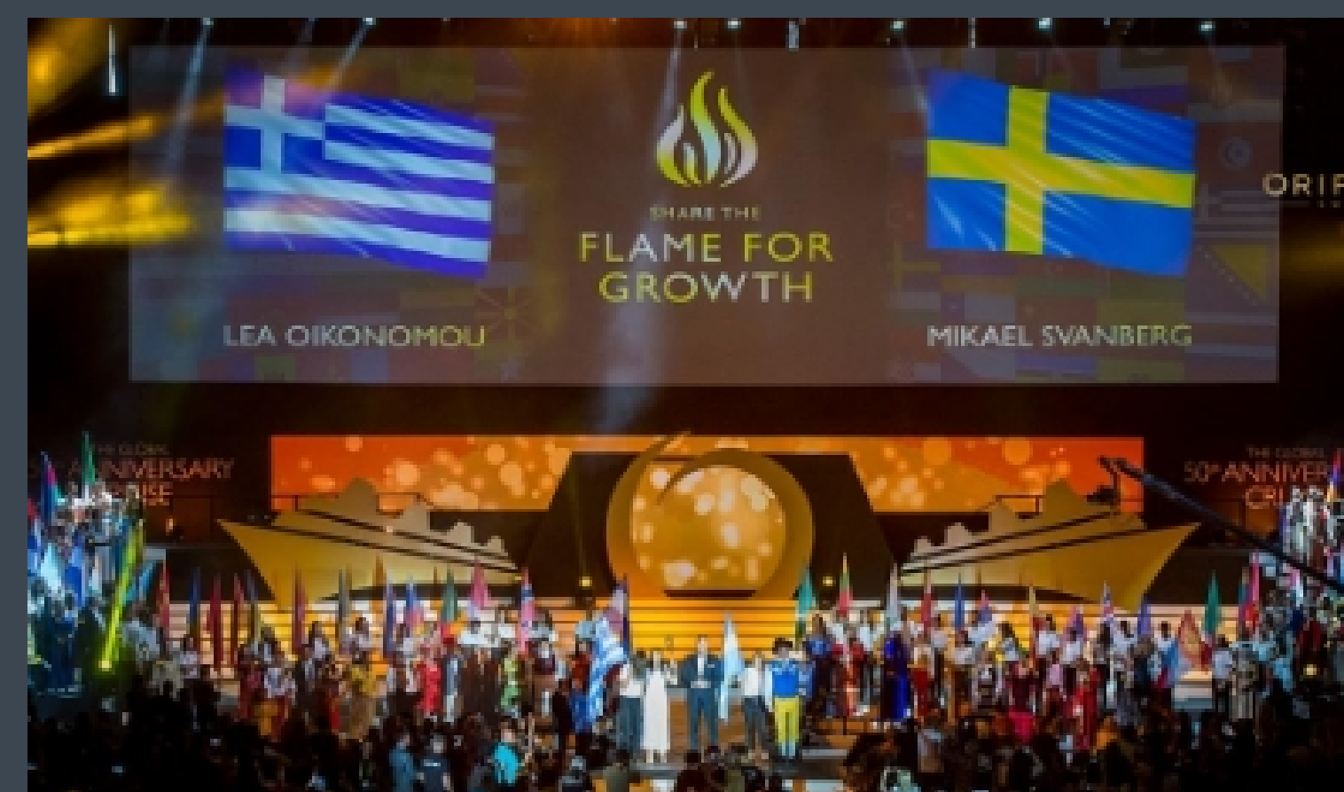
Oriflame Gold Conference Atenas