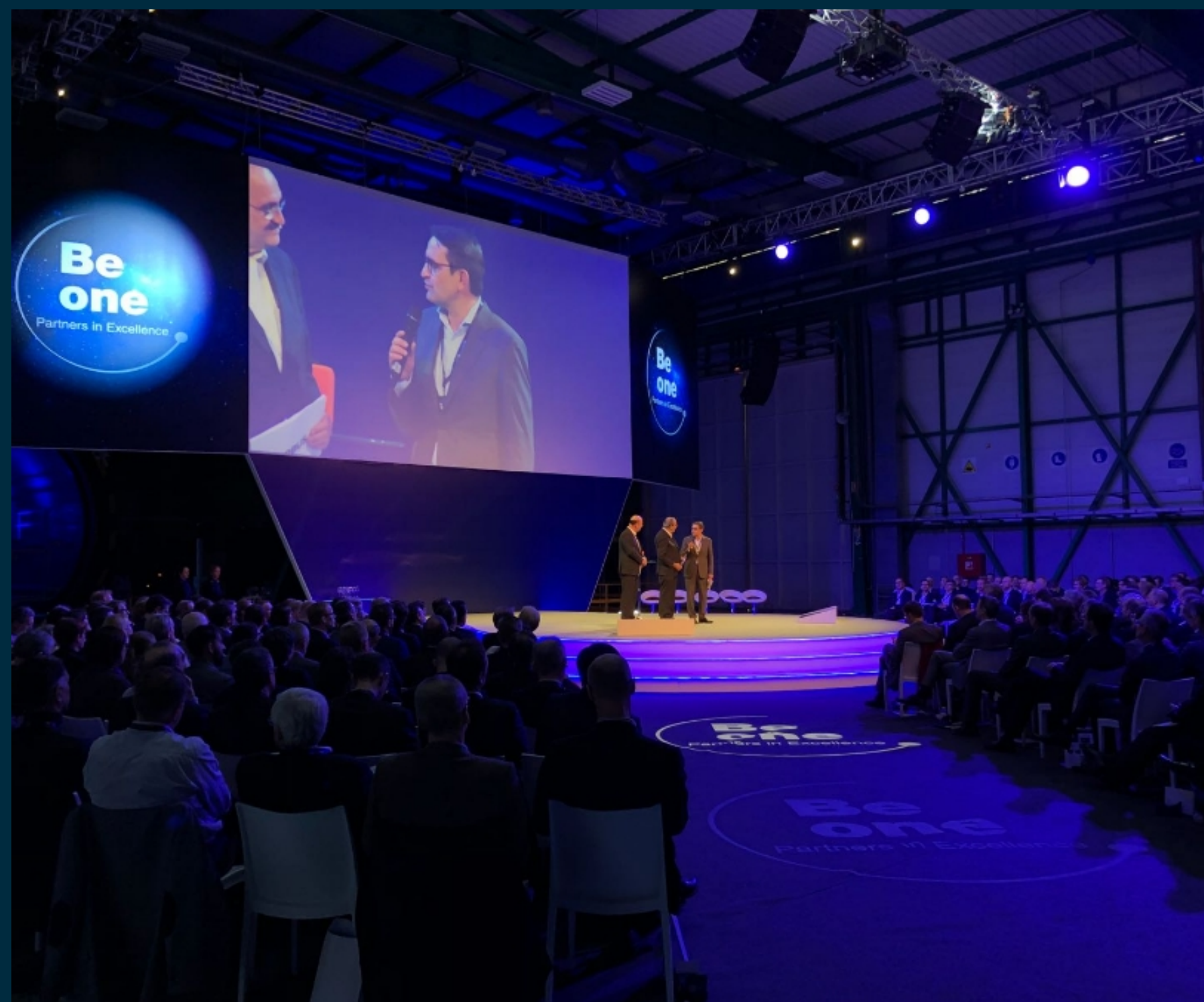
Airbus Be One El Puerto de Santa María

Conceptualización, Diseño y Activaciones