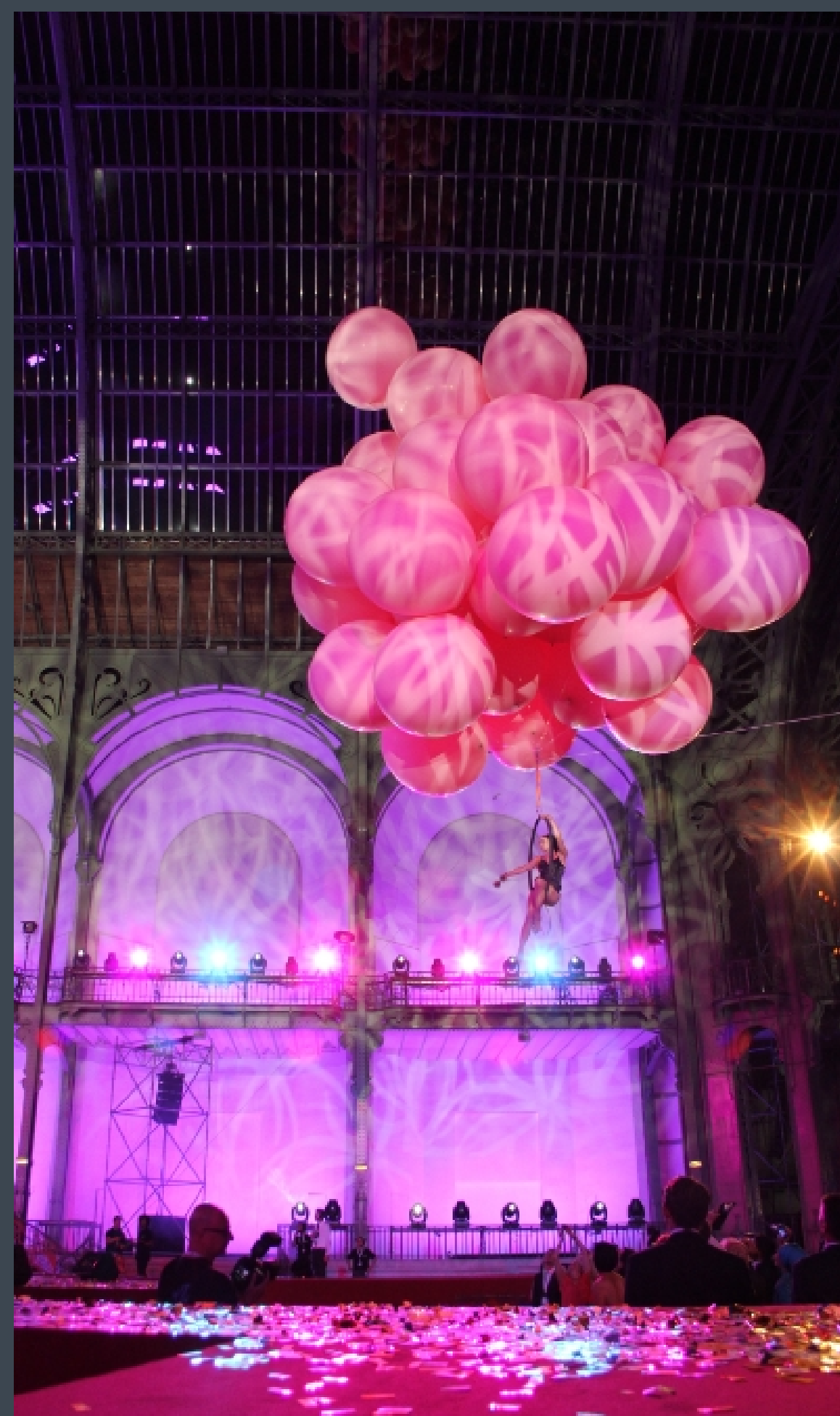
Oriflame Gold Conference Paris

Conceptualización, Diseño y Activaciones