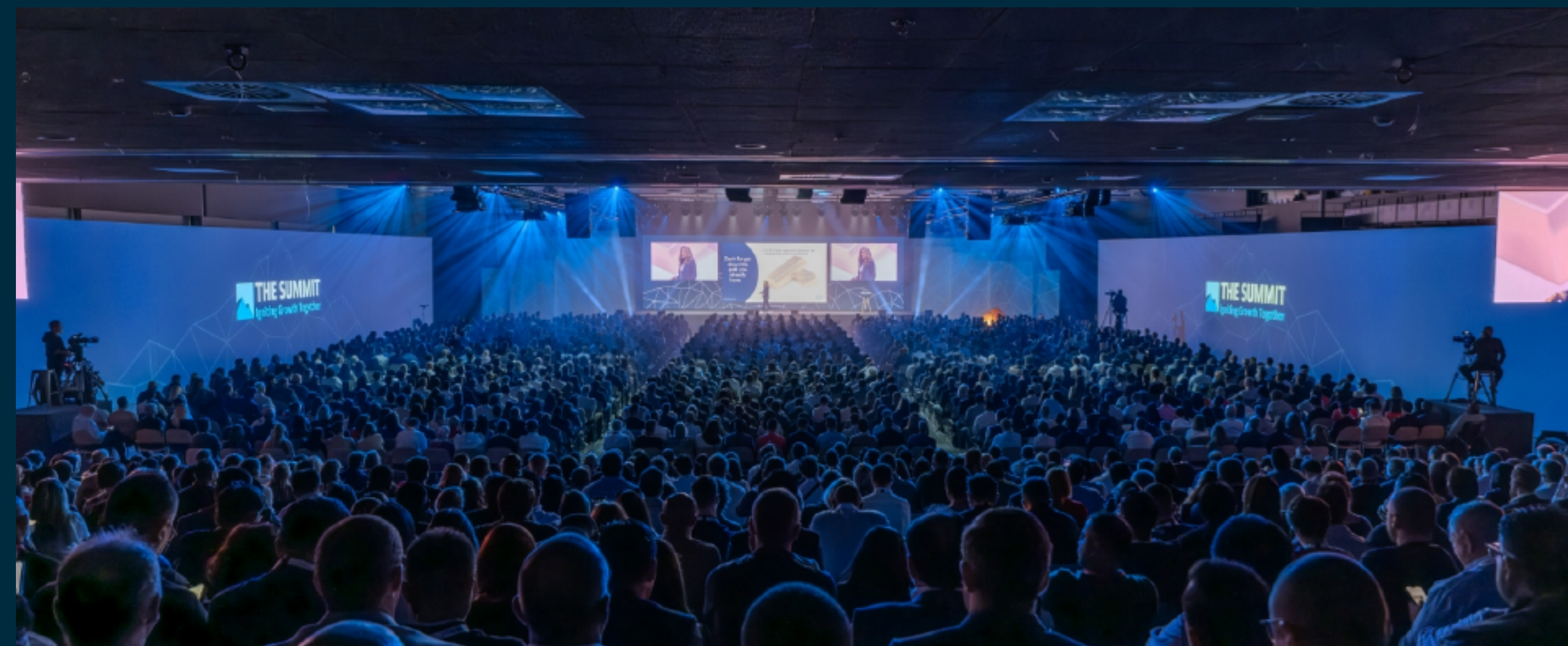
Maersk The Summit Tarragona 2023