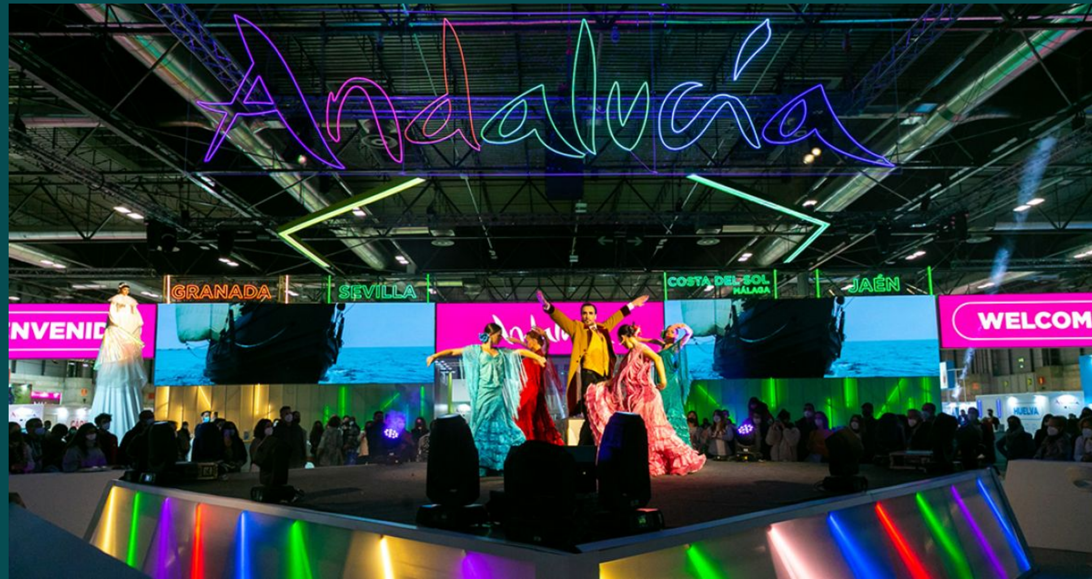
Stand Turismo de Andalucía en FITUR 2021/ 2022/ 2024

Conceptualización, Creatividad y Activaciones