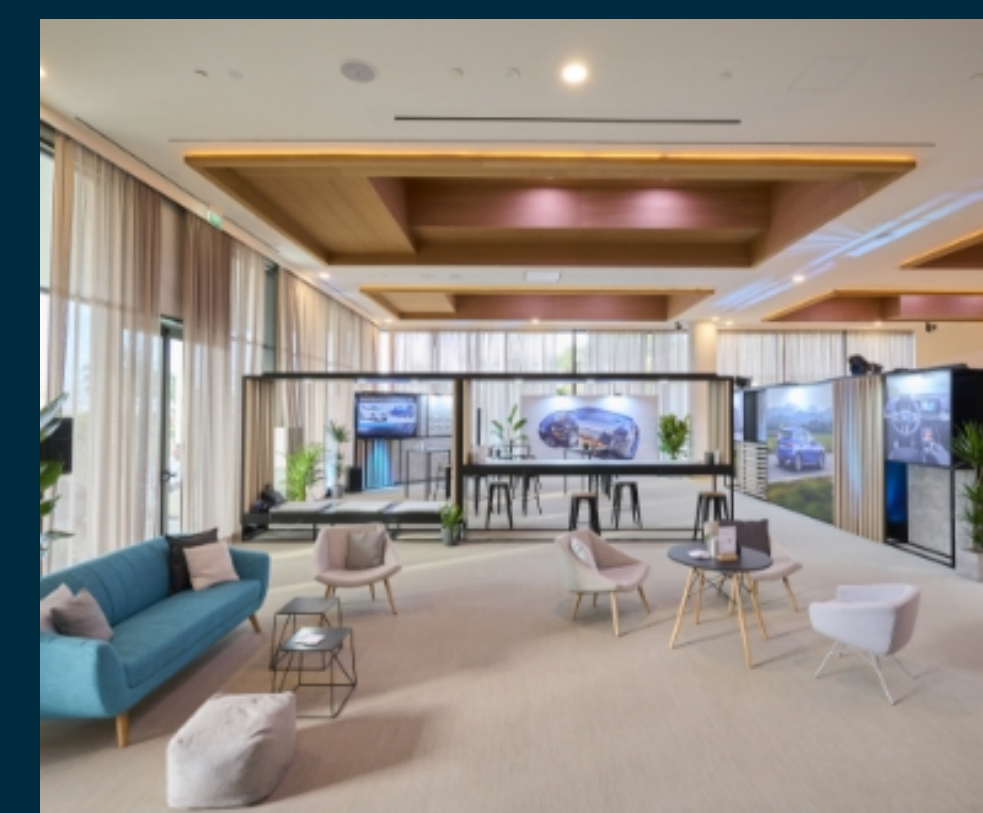
BMW Motor Rad Road Show