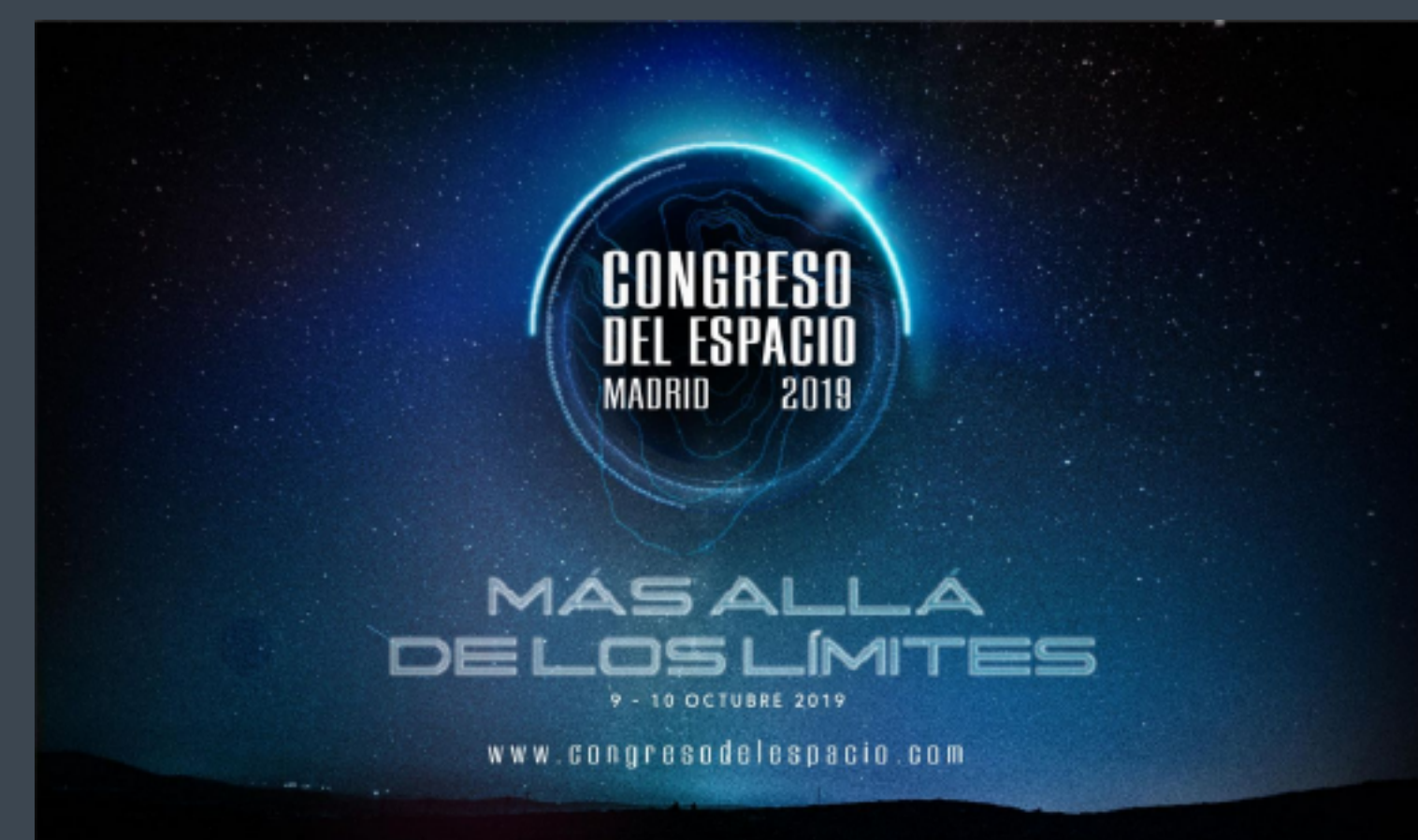
Congreso del Espacio Madrid 2019